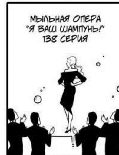
МЫЛЬНАЯ ОПЕРА "Я ВАШ ШАМПУНЬ!" 138 СЕРИЯ