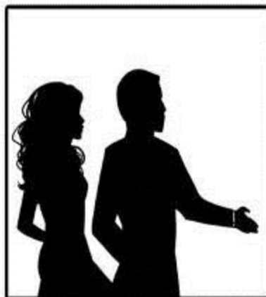
КОМАНДА СТУДИИ ПОНРАВИЛАСЬ НАМ С ПЕРВОГО ВЗГЛЯДА.