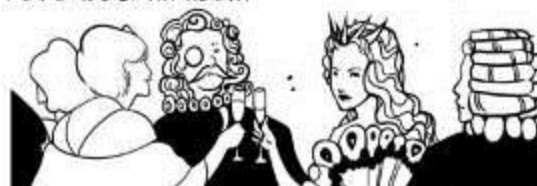
МОТИВИРОВОЧНЫЙ ТАНЦЕВАЛЬНЫЙ МЮЗИКЛ "ДЕЛАЙ ТРЕЙД!"